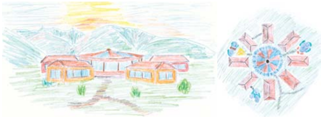
„Ideenskizze“ vom neuen Zentrum.

Dies ist noch mehr als die Wertschätzung, die sie jetzt schon durch therapeutische Zuwendung erfahren, nachdem sie zuvor von ihrer Umgebung meist nur „verwaltet“ wurden und ohne Perspektive waren.