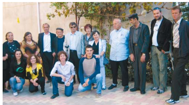
Wieder gut zu Fuß: eine Reihe dankbarer Patienten. Davor die Mitarbeiter in Albanien, die das „verursacht“ haben.

Wenn Sie die Überweisung gut lesbar beschriften, erhalten Sie zu Beginn des Folgejahres mit herzlichem Dank eine Spendenbescheinigung!