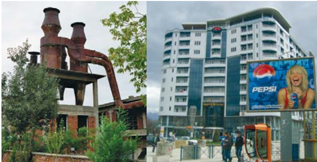
Albanien zwischen „Alt“ und „Neu“ – auf gutem Weg?

Dieses kleine Land „vor unserer Haustür“ hat ein riesiges Potenzial. Nach jahrzehntelanger Abkopplung vom Rest Europas bis 1990, bedingt durch eiserne Diktatur, besteht langfristig Nachholbedarf. Obwohl wichtige Schritte zu mehr wirtschaftlicher und sozialer Stabilität getan werden, gehört das Land noch zu den ärmsten Europas – dabei ist es sehr reich an Bodenschätzen! Um die Ressourcen zu nutzen, werden noch viele Investitionen notwendig sein.