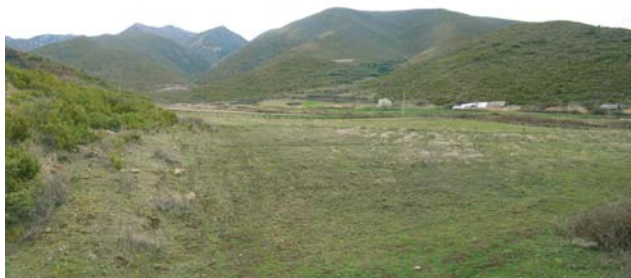
Hier soll das MNA-Therapiezentrum entstehen.

In diesem Zentrum sollen durch Seminare in verschiedenen Fachgebieten Mitarbeiter und Patienten geschult werden. So wollen wir helfen, das albanische Gesundheitswesen mit aufzubauen.